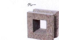
■フレームブロック■