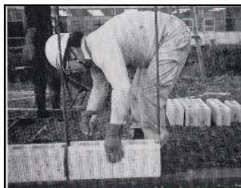
④ 1段目のブロック積み (ブロックの水平に注意)