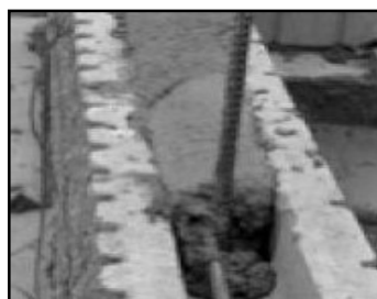
⑧ 横筋を配置したところはモルタルを詰める