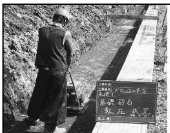
① 地面を掘り砕石を敷いて埋戻して、機械で転圧