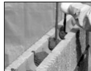
⑥ 縦筋の部分、縦目地の空胴部分にモルタルを詰める