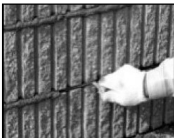
⑩ 目地さらえ、目地押さえをする