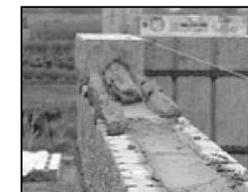
⑨ 笠木をモルタルでしっかりと付ける