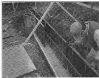
② 基礎と塀の鉄筋を配筋、枠を組み、コンクリートを打込む