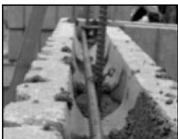
⑦ 所定の段に横筋を配筋