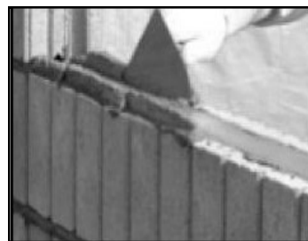
⑤ 2段目以降、所定の高さまで積む